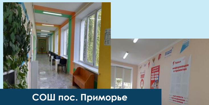
СОШ пос. Приморье