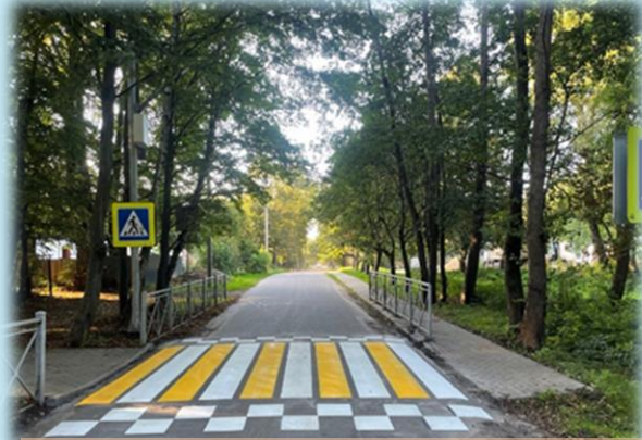
пос. Приморье, ул. Артиллерийская