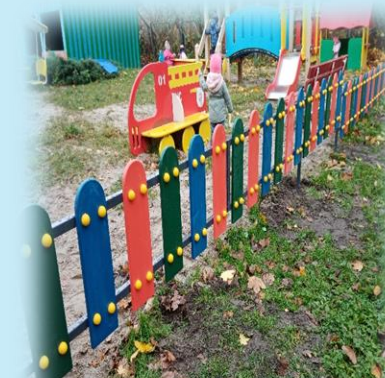
Детский сад «Одуванчик»