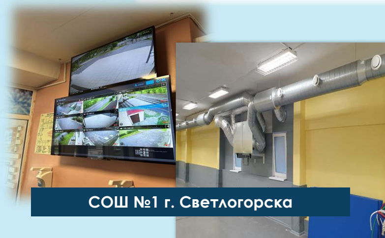
СОШ №1 г. Светлогорска