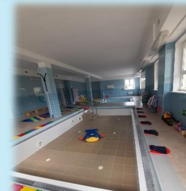
Детский сад «Солнышко»