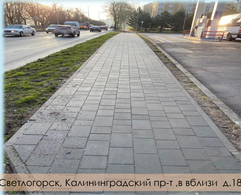
г. Светлогорск, Калининградский пр-т, вблизи д.18А