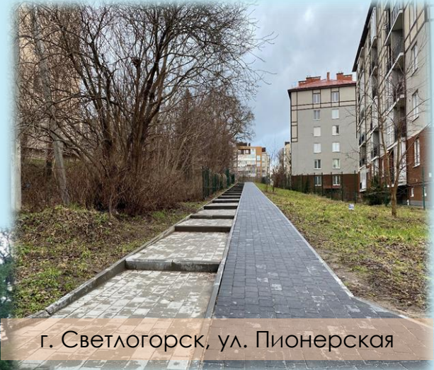
г. Светлогорск, ул. Пионерская