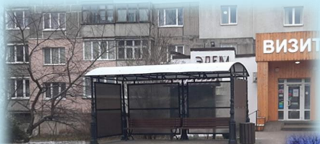
г. Светлогорск, ул. Пригородная