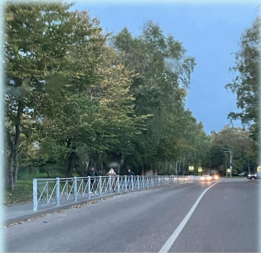
г. Светлогорск, ул. Пионерская