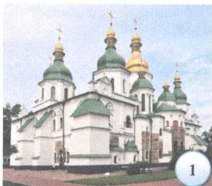
Софийский Киевский собор