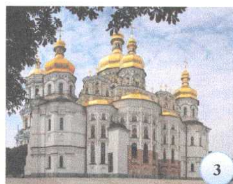
Успенский собор Киево-Печерского монастыря