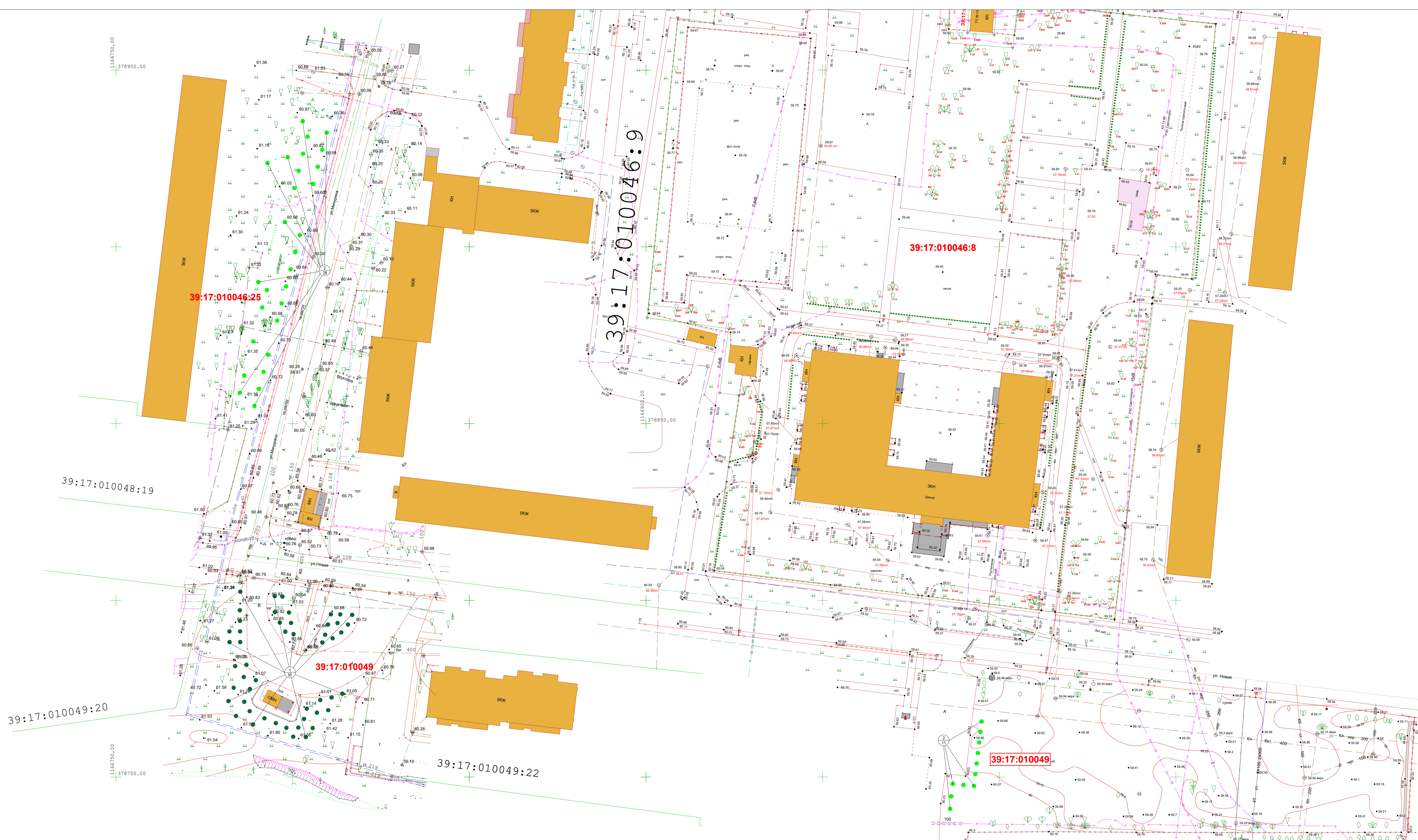
ВЕДОМОСТЬ ЭЛЕМЕНТОВ ОЗЕЛЕНЕНИЯ