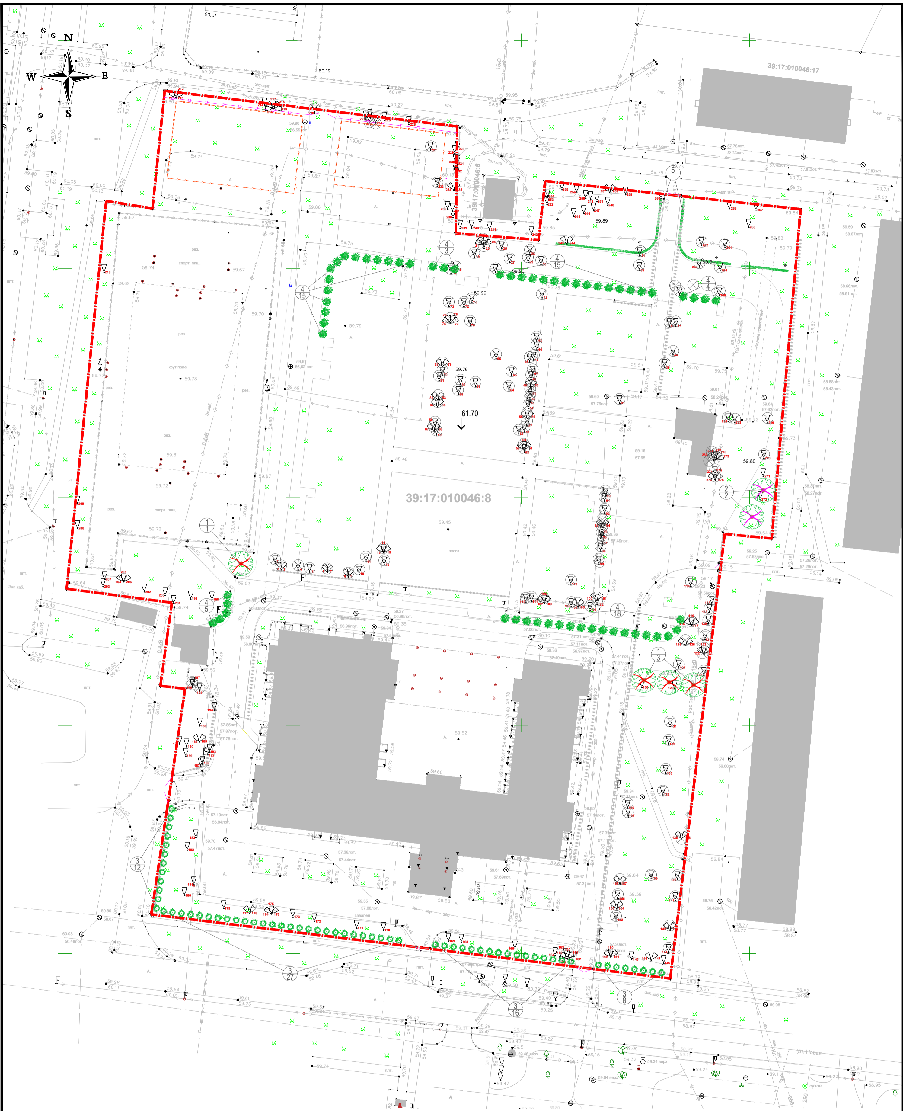
ВЕДОМОСТЬ ЭЛЕМЕНТОВ ОЗЕЛЕНЕНИЯ