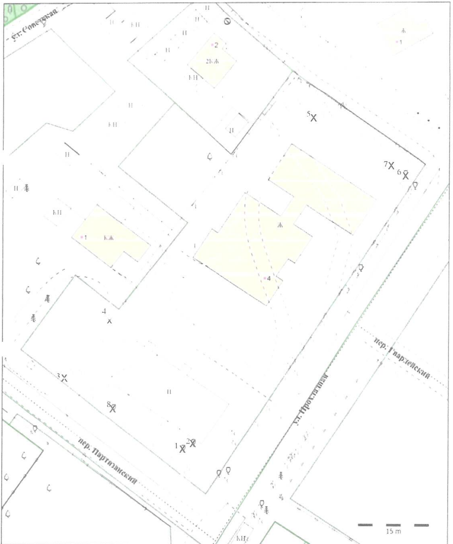
Схема вырубki деревьев (на схеме подеревной съемки на земельном участке) 39:17:020005:11 г. Светлогорск, ул. Прохладная