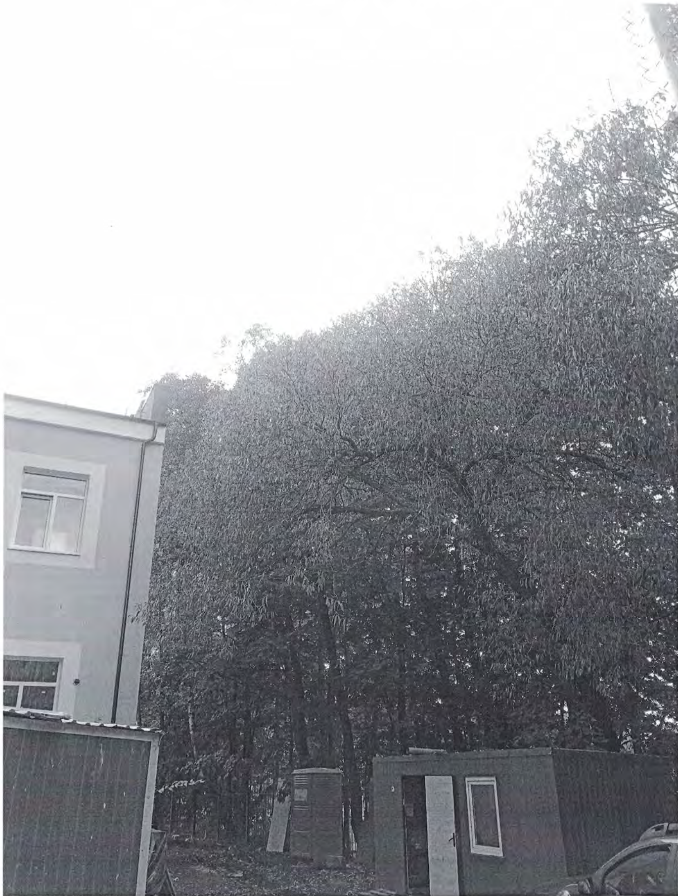
— IMG_20241010_144406_300.jpg —